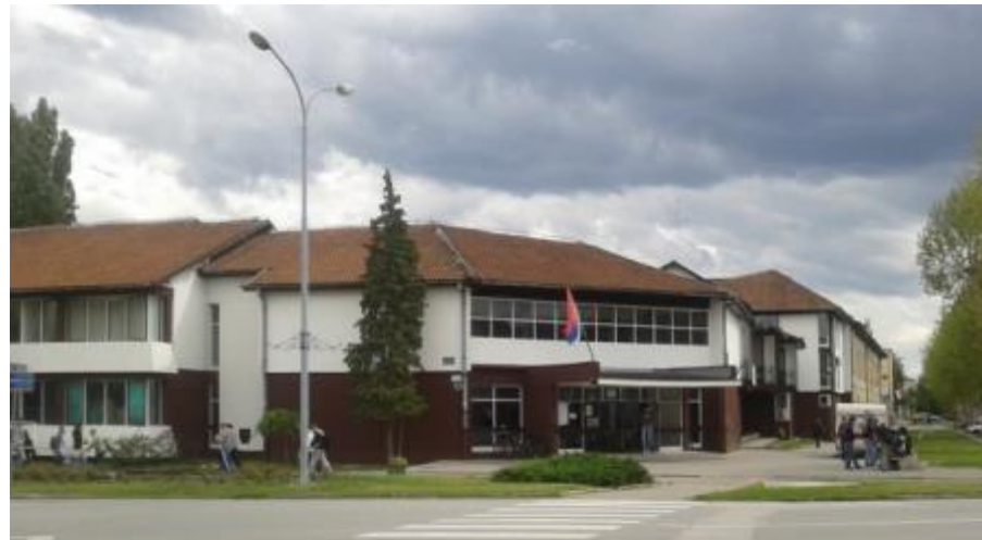
Техничка школа “9. мај”, Бачка Паланка

Како бисмо спречили опадање броја ђака, све више се окрећемо образовним профилима (редовним и огледним) који подразумевају употребу ИТ, те је један од главних задатака, истакнут и у Програму рада школе, постало јачање дигиталне писмености наставника и ученика.